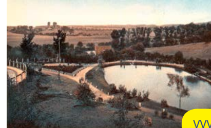
VVV-vijvers / Railbus Miljoenenlijn

We gaan op zoek naar natuurlijke plekken van plezier in Kerkrade. We wandelen door het Hambos, het eerste wandelpark van Kerkrade en langs de VVV-vijvers. Verder naar kasteel Erenstein, ooit het museum van Kerkrade. Hier lag ook de eerste roeivijver. We keren via het stadspark terug naar de Markt waar het festijn 'Kirchroa jeet plat' losgebarsten is. N.B. vanwege het evenement 'Kirchroa jeet plat' is de uitleg tijdens de rondleiding in het Kirchröadsjer Plat. Gratis / Aanmelden via ivn.kerkrade@gmail.com / Vertrekpunt: parkeerplaats Continium, Hambosweg te Kerkrade.