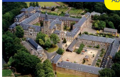
Abdij Rolduc / Baalsbruggermolen