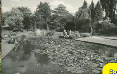
Botanische Tuin / Stadspark